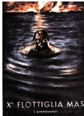
Una cartolina sugli uomini "Gamma"