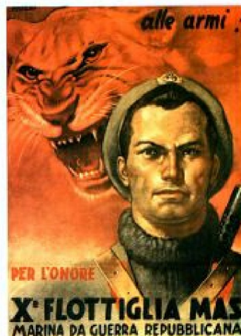
Un manifesto di propaganda al tempo della R.S.I.

E' il boom del consenso, migliaia di giovani si presentano per arruolarsi volontariamente attirati dagli ideali di Onore, Fedeltà, Coraggio che la Decima MAS più di qualsiasi altro rappresenta. La carenza di mezzi navali porta alla formazione di battaglioni di fanteria di marina, ma comunque molti volontari verranno poi dirottati negli organici delle 4 divisioni che il governo della R.S.I. sta approntando; quelli che resteranno daranno vita ai vari reparti della "Divisione Fanteria di Marina Decima" ed a pochi ma agguerriti reparti di mare, la cui gloriosa storia potete trovare nelle pagine sulla "struttura". Sulla Decima in generale vanno però chiariti alcuni aspetti