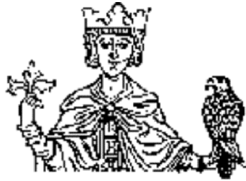
Federico II in una raffigurazione classica

Ricorre quest'anno lottavo centenario dalla nascita di un grande sovrano. Un personaggio che non cessa di affascinare per la straordinaria modernità della sua azione politica e culturale che gettò, in pieno medioevo, le basi di un moderno Stato di diritto. Figlio di Enrico di Svevia e di Costanza d'Altavilla, dopo otto secoli, travolge ancora, gli studiosi, per la sua straordinaria cultura e per le sue imprese di sovrano e condottiero. Il nostro interesse è accresciuto dal fatto che stiamo parlando di un personaggio universale che non appartiene soltanto alla storia d'Europa, ma soprattutto alla storia d'Italia ed alla sua cultura tradizionale. D'origine tedesca, Federico II, crebbe e fu educato a Palermo, dedicò sempre maggiori cure ai suoi uomini, in Italia, con particolare riguardo al Regno di Sicilia che considerava sua seconda Patria e che, a quei tempi, comprendeva quasi tutta l'attuale Italia meridionale. Se fosse riuscito nei suoi vari tentativi di unificare i suoi due regni in terra italiana, la nostra Nazione avrebbe avuto uno Stato unitario molti secoli prima. I suoi tentativi non diedero i frutti sperati per i molti ed insormontabili ostacoli che il potere temporale della Chiesa frapponneva con l'imperatore e la sua fantastica utopia unitaria, in nome di un solo credo, delle italiche Genti.